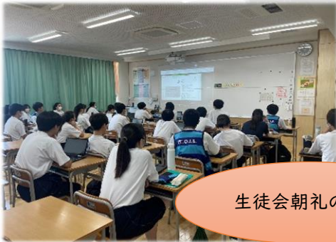
生徒会朝礼の様子

Semester Iもあと少しで終わります。ポートフォリオ検討会で考えたことなどを生かして、一日一日を大切に過ごすことで、可能性は大きく広がっていくのではないのでしょうか。