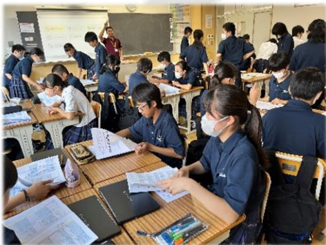
↑ ある日のAll Englishの様子

また、6 月末より、HR委員の発案で、この学年をよりよくしていくための月間目標、週目標を設定しています。学習面だけでなく、生活面でも成長しようとする姿が見られています。